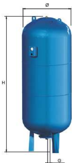
AFE 750 d. 750